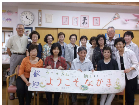
上：新組合員さんウェルカムパーティー