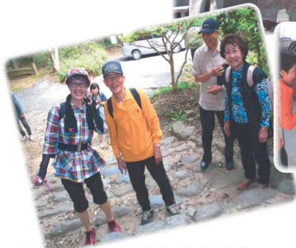
まんなが支部・おでかけ (余野公園)