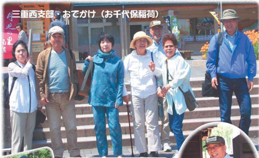
三重西支部・おでかけ (お千代保福荷)