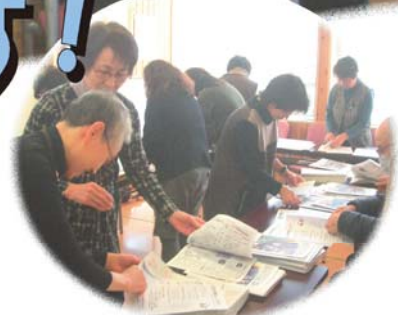
当日は折込み・仕分け体験も。

みえ医療福祉生活 協同組合・四日市地域 〒512-0911 四日市市生桑町1455 TEL (四日市地域本部) 059-330-0808 FAX (四日市地域本部) 059-330-0807 組合員数 (四日市地域) 4614世帯 2月加入数 2月脱退数 1世帯 5世帯 出資金増資 (四日市地域) 304名 984回 6,434,000円 (2/28現在)