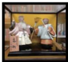
ホームページにて公開中