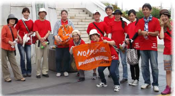
昨年の平和行進 (四日市市役所前にて)